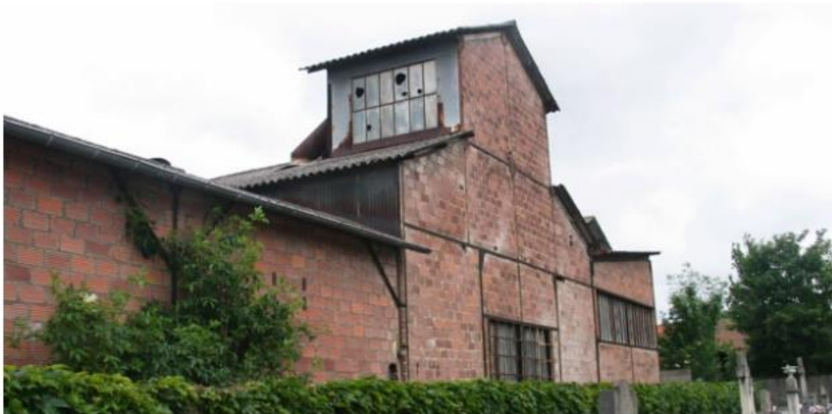
Le CMMP - ici en 2009 - a broyé de l'amiante jusqu'en 1991 en plein cœur d'Aulnay-sous-Bois.

De quoi interroger ces adolescents habitant aujourd'hui à proximité de l'ex-CMMP - démoli en 1991, remplacé par une dalle de béton. « Pourquoi des personnes sont tombées malades, et d'autres non ? », demande l'un, résumant la préoccupation de la classe, inquiète de savoir si le site est toujours dangereux. « A Aulnay, il ne présente plus de risque, car il a été dépollué. Mais tout le monde peut attraper un cancer : en France, il y a de l'amiante partout, son retrait se fait très lentement », répond Emilie Counil.