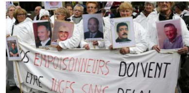
Des manifestants brandissent des portraits de victimes de l'amiante, en février 2013 à Paris

autoriser une précarisation généralisée de l'emploi, qui fait obstacle à toute forme de prévention et de suivi sanitaire des travailleurs exposés à des substances dangereuses.