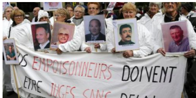
Des manifestants brandissent des portraits de victimes de l'amiante, en février 2013 à Paris

PAR RACHIDA EL AZZOZI ARTICLE PUBLIÉ LE VENDREDI 1 JUILLET 2016