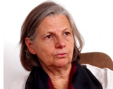
Annie Thébaud-Mony

lui avait accordé un non-lieu devant la cour d'appel, estimant notamment qu'il n'avait aucune obligation particulière de sécurité en matière d'amiante.