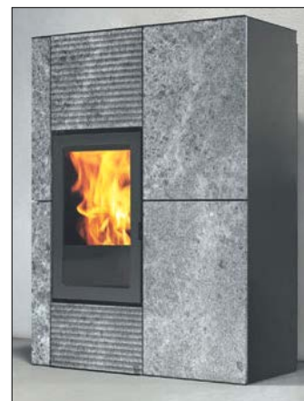
Ancien et fourneau moderne en pierre ollaire.

contiennent de l'amiante, celui-ci est fortement lié dans la pierre et n'est pas libéré, pas même lorsque le fourneau est chaud. Il existe cependant de nombreux résultats d'analyses indiquant que ces produits ne contiennent que rarement de l'amiante". Cependant il est important de relever que certaines roches importées, notamment du Brésil, en contiennent. Par conséquent, la fabrication ou la réparation de ces fourneaux devrait être interdite vu les risques qu'ils présentent pour les tailleurs, polisseurs et concasseurs de ces pierres amiantées car le marché mondialisé des pierres de taille peut réserver de mauvaises surprises. Ceci d'autant plus que, la surveillance de ces travaux dans les carrières et les ateliers de taille n'étant pas assurée, ces roches amiantifères ne devraient pas faire exception et doivent demeurer interdites d'exploitation comme tous les autres amiantes.