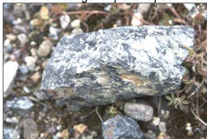
Veines d'amiante chrysotile incrustées dans une éclat de serpentine provenant de la carrière de Canari en Corse.

Le site Wikipedia note à propos de la toxicité des serpentines: Risque d'asbestose, comme pour les amiantes, notamment à la suite du sciage, ponçage, perçage de la roche : les formes amiantées peuvent se retrouver dispersées dans l'atmosphère et si elle sont utilisées pour les revêtements routiers, devenir un danger important pour la santé.