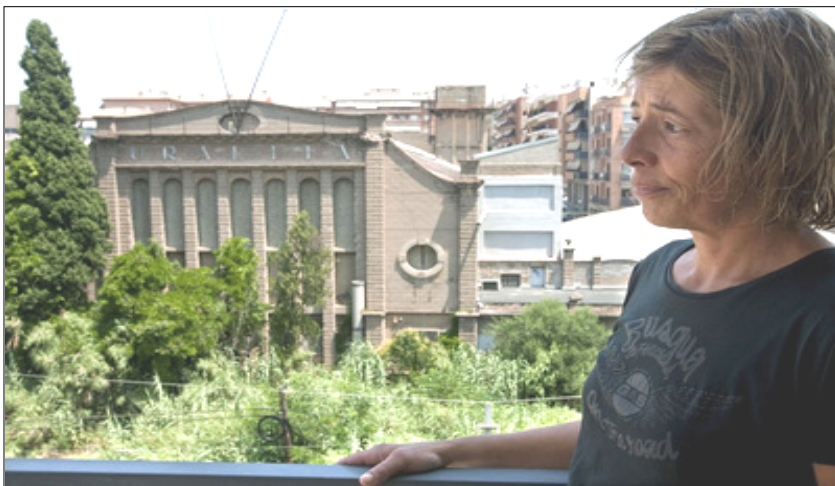
Une habitante voisine de l'usine Uralita de Cerdanyola à Barcelone