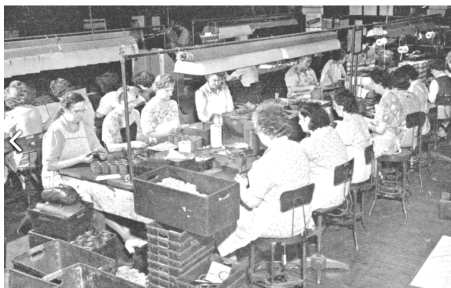
Le vécu de ces sept femmes exceptionnelles ne doit pas masquer le destin tragique de milliers d'autres victimes parmi les ouvrières de l'amiante.