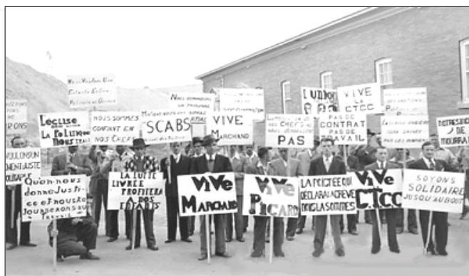
Manifestation de colère des mineurs de Thetford Mines lors de la grève de l'amiante en 1949. On lit sur les pancartes: Qu'on nous donne justice et nous retournerons au travail. La lutte profitera à nos enfants, Soyons solidaires jusqu'au bout !